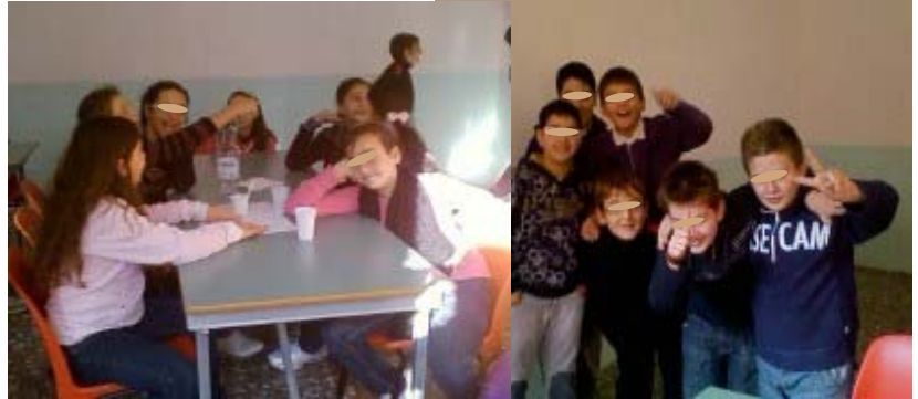
Un momento della pausa pranzo presso la "De Sangro"

Il corso è bellissimo, siamo tutti felici e crediamo che sarà una bella esperienza che ci accompagnerà per questi tre anni di scuola media. IF