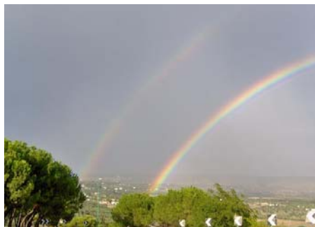
Arcobaleno fotografato dalla "Serpentina" (Mottola)

nuovi libri di testo (come forma nonviolenta di protesta) con l'attenzione rivolta all'e.book e l'attiva-