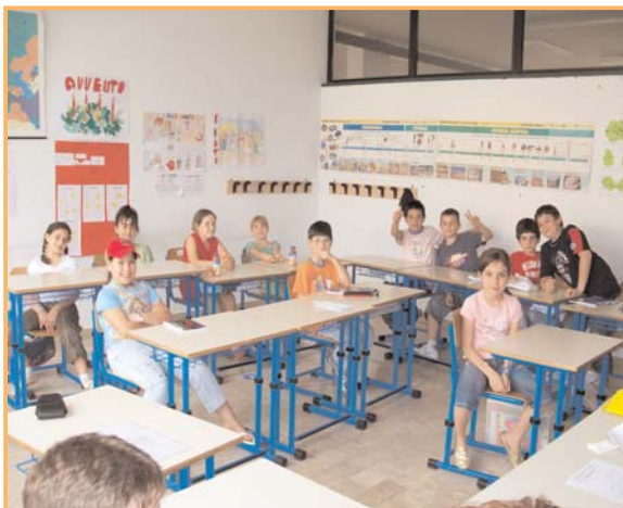
Un momento di svago