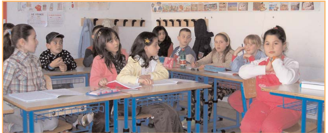
Due momenti del corso di giornalismo