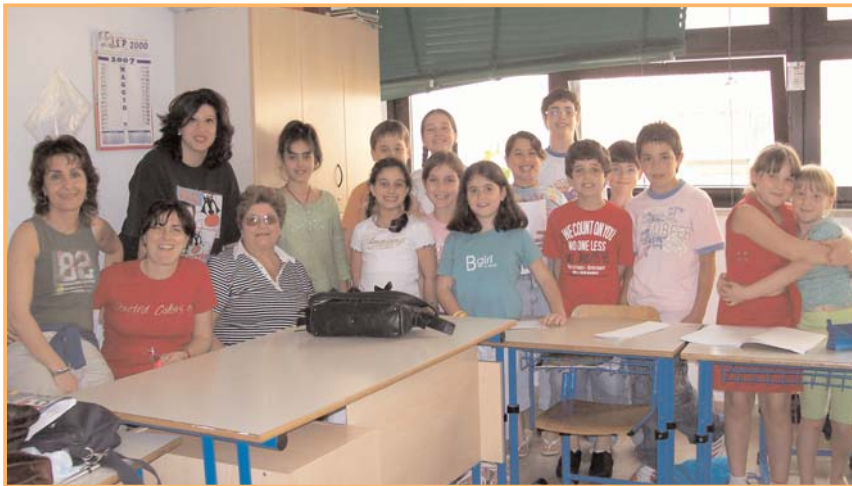
Foto di gruppo alla fine di un appuntamento del corso di giornalismo