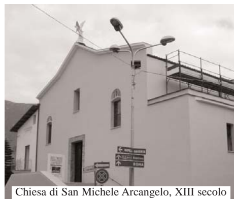
Chiesa di San Michele Arcangelo, XIII secolo