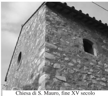
Chiesa di S. Mauro, fine XV secolo

Quest'anno, con orgoglio, vi offriamo una nuova traccia grafica dei monumenti mondragonesi, ritraendo quelli che hanno beneficiato di lavori di restauro che li hanno resi finalmente più belli ai nostri occhi e anche più resistenti nei confronti dei danni dell'uomo e del tempo. Con la speranza che altri interventi di tale interesse riguardino i monumenti che sono ancora preda del degrado e dell'incuria.