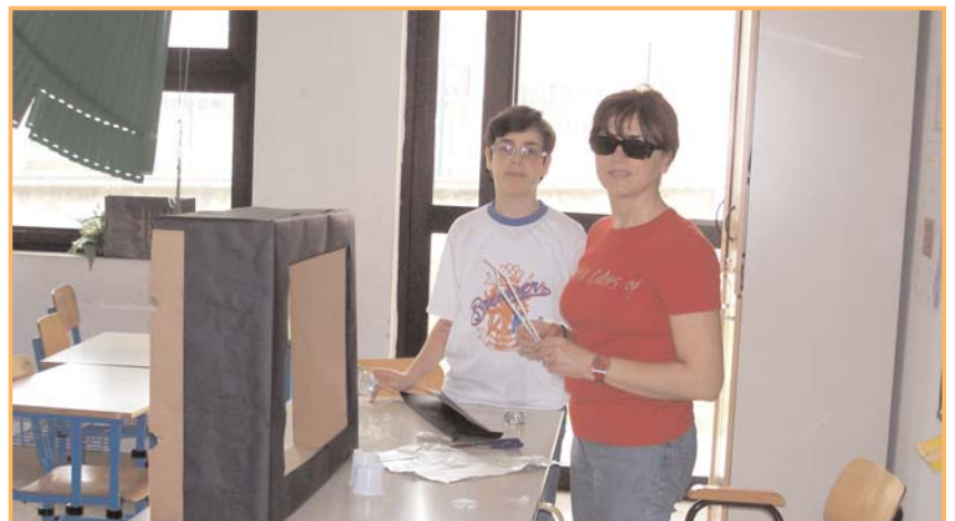
Una piccola pausa durante la realizzazione del televisore