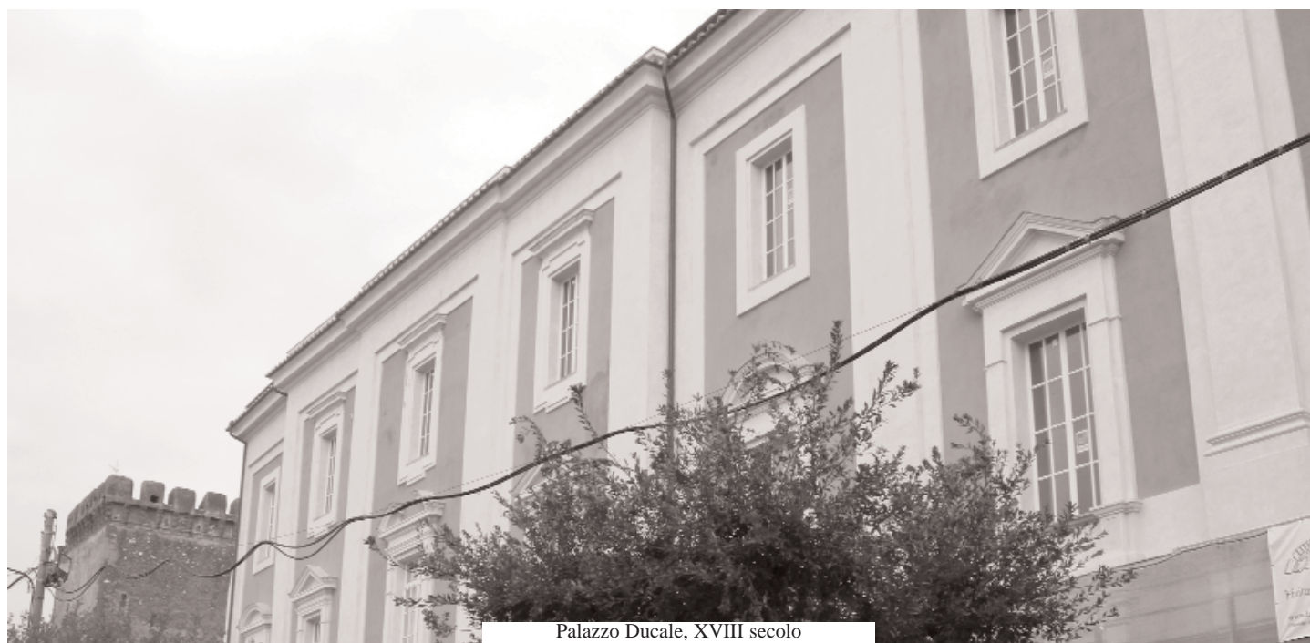
Palazzo Ducale, XVIII secolo